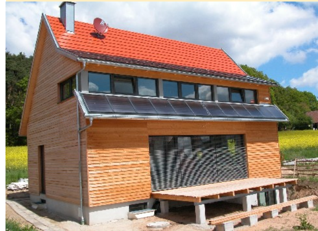
Beheizung und Stormversorgung komplett regenerativ: Passivhaus in Kammerstein