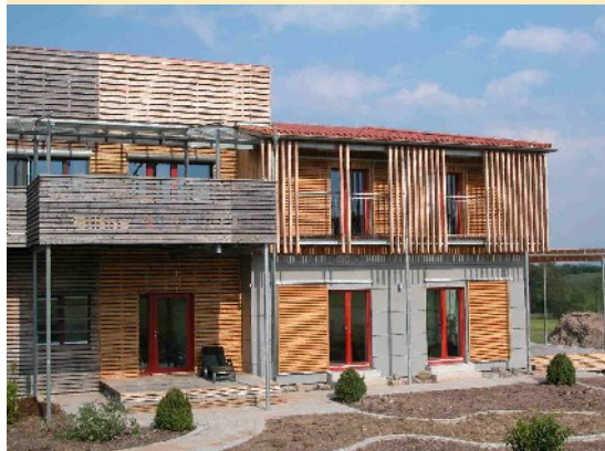
Passivhauswohnhausneubau an die Tierarktklinik in Feuchtwangen

Angefangen beim energetischen Altbau von 1984 der mit 18-30 Liter Heizölverbrauch ( 180 – 300 kWh) pro qm Wohnfläche einen deutlichen Sanierungsbedarf aufweist, steht am Ende des derzeit wirtschaftlich Möglichen das Passivhaus als Gebäude mit einem Energieverbrauch von nur noch 1,5 Liter (15 kWh) pro qm und Jahr.